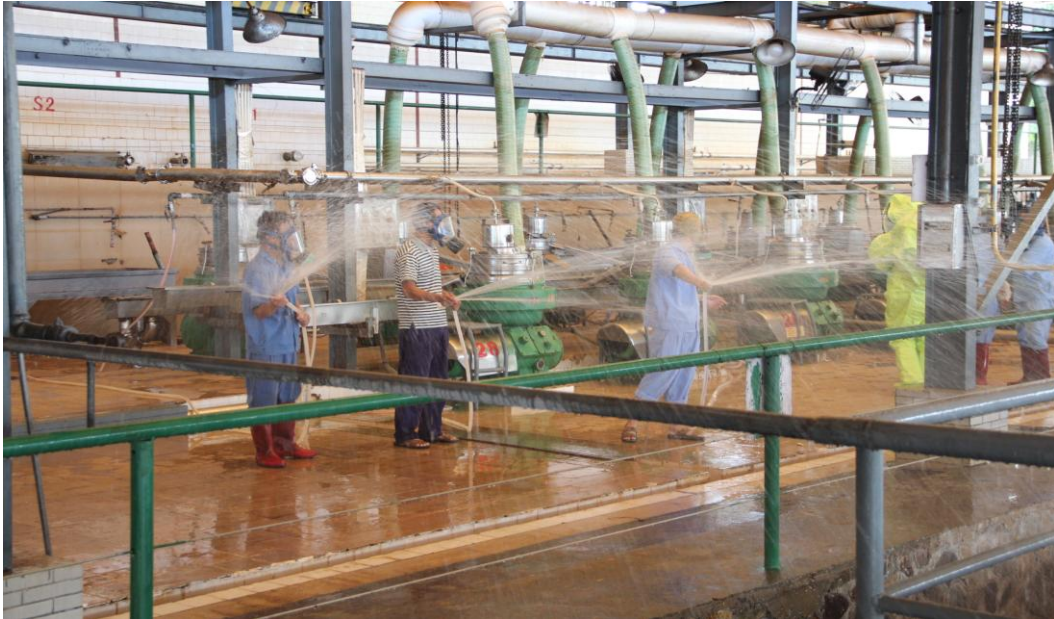
图 11 金联橡胶加工分公司液氨泄露演练