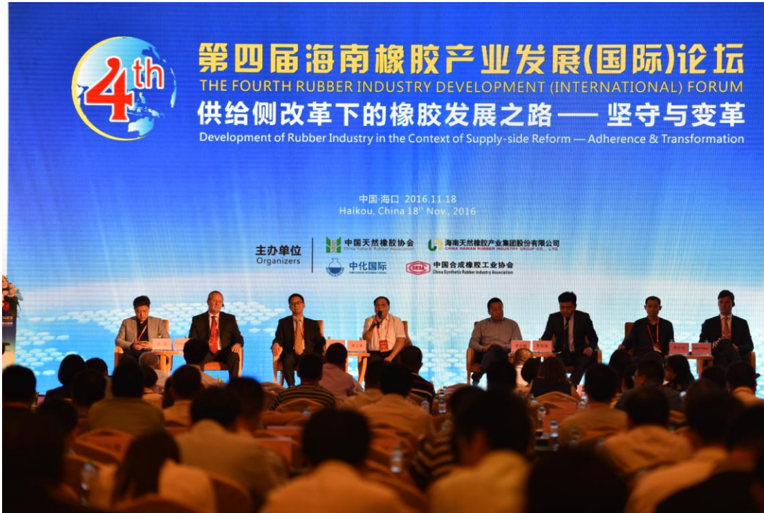
图 6 论坛互动环节嘉宾就《天然橡胶产业链健康发展之路》进行现场探讨

来越大，权威性越来越强，已成为行业内的一大盛会。公司积极借助论坛向外界传递公司的经营理念和企业文化，增强在行业内的影响力。