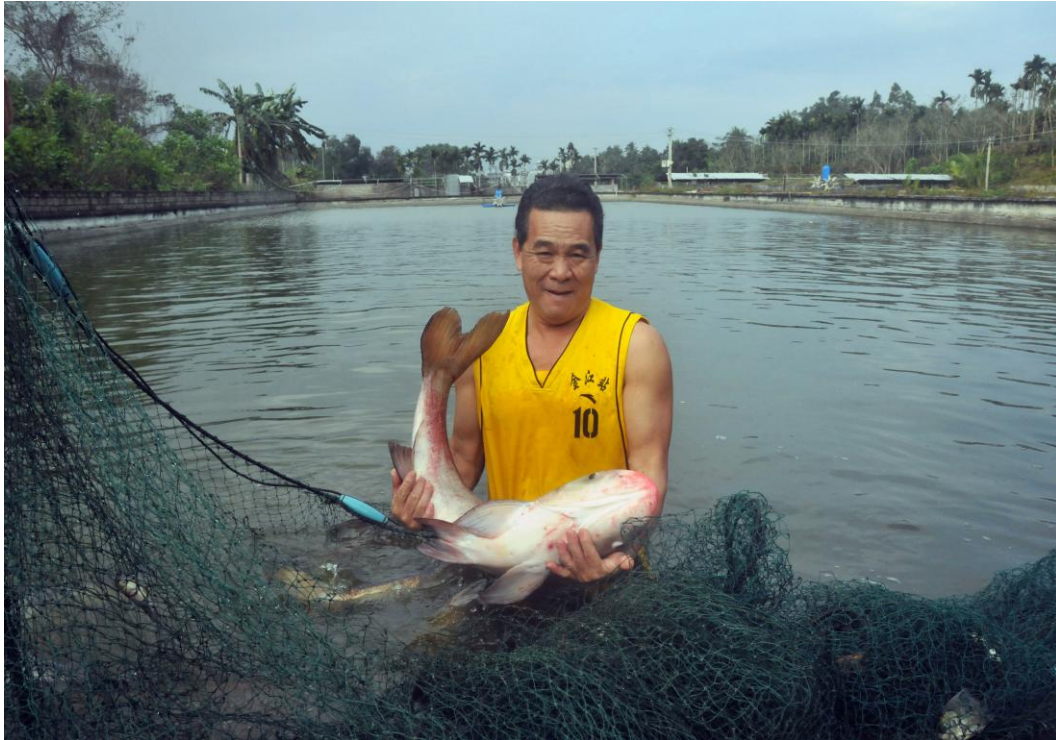
图 9 金江七仙瑶池合作社——渔业丰收