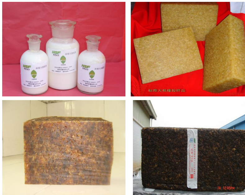
图3 天然橡胶初加工产品