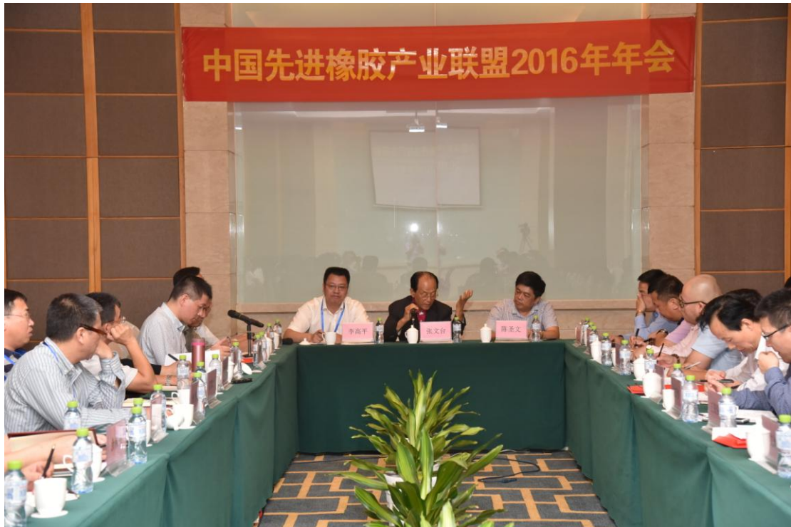
图 5 中国人民解放军总后勤部原政委、中国先进橡胶产业联盟总顾问张文台在年会上讲话

公司主办的中国先进橡胶产业联盟 2016 年年会审议通过了《联盟联络员管理暂行规定》，进一步增强成员间的信息沟通和资源共享。来自 23 家橡胶行业的企事业单位、科研院所、高等院校的 40 余名联盟代表参加了会议。