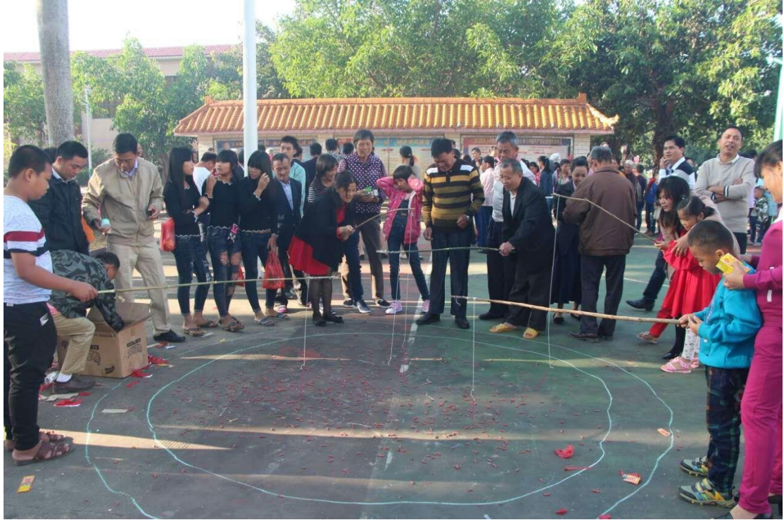
图 8 保国分公司员工春节游园活动

讲座；为加钊、立才等 5 个单位近 500 名一线优秀员工进行健康体检；在西联、阳江、邦溪等基层单位开展了“法律大讲堂”活动；在新中、中坤、八一等 12 个基层工会开展了送文艺下基层活动；在直属机关等单位组织开展了“幸福海胶、快乐健步”活动。