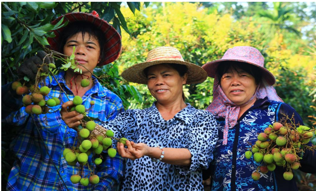
图 10 巾帼迅达合作社——巾帼班摘荔枝