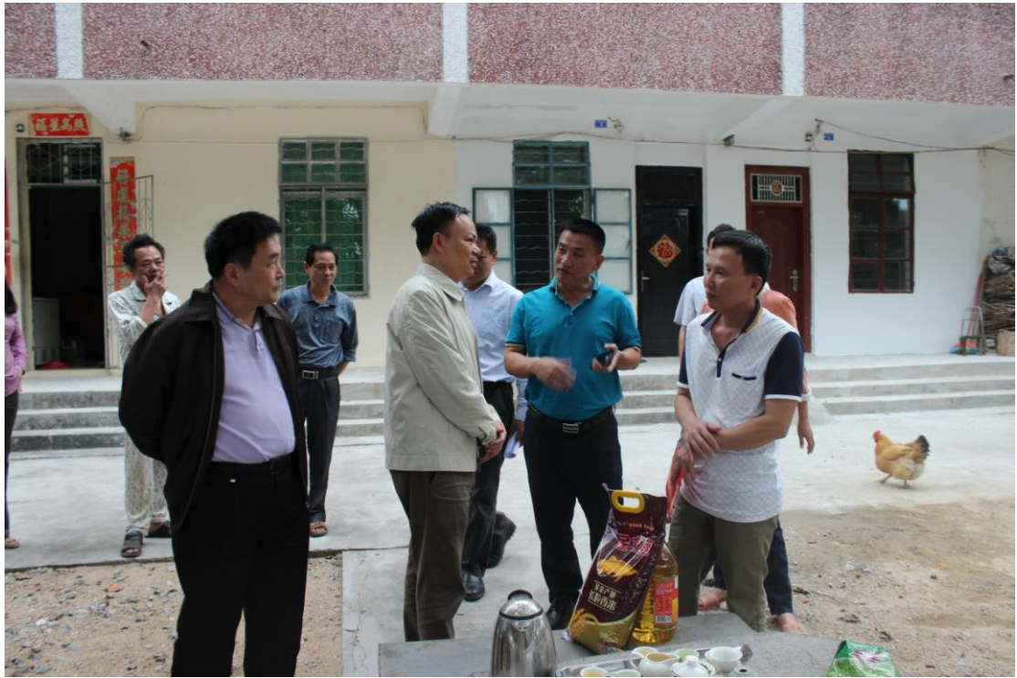
图 7 山荣分公司领导深入基层慰问困难员工 2、改善员工工作生活环境

公司建立工会干部“结对子”帮扶、日常慰问生病住院和困难员工等工作机制，积极开展“走基层、听呼声、办实事”活动。通过基层座谈、上门走访等形式慰问了 340 名困难员工。两节期间，公司在海南省、海垦控股集团工会的大力支持下拨出慰问金 898 万元，慰问帮扶 20690 户次困难员工。协助龙江、东太、长征、白沙等 9 个基层工会为 2300 多名因“电母”、“莎莉嘉”台风受灾失岗员工向海垦控股集团工会申请灾后生活救助金 66 万元。