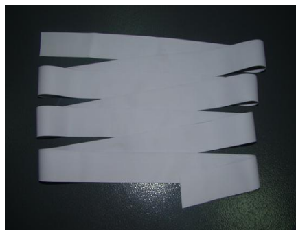
图 4 天然橡胶深加工产品-乳胶丝